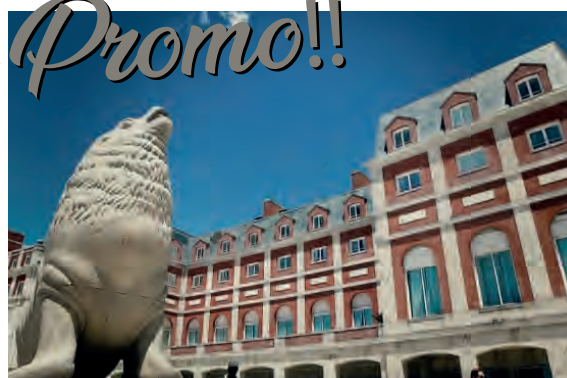
MAR DEL PLATA