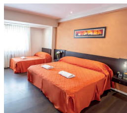
HOTEL PUNTA PIEDRAS