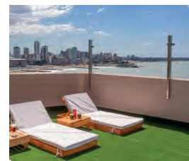
HOTEL PUNTA PIEDRAS