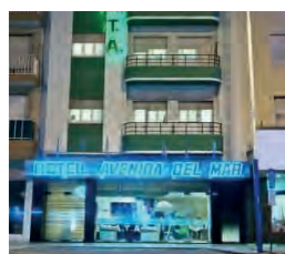
HOTEL AVENIDA DEL MAR